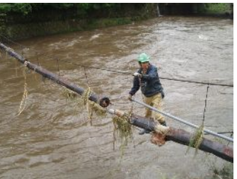
早川横断パイプ破損