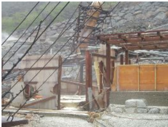
湯の花乾燥施設崩壊