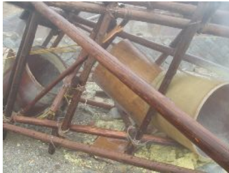
温泉造成施設の倒壊