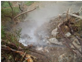
土砂崩落によるパイプライン寸断